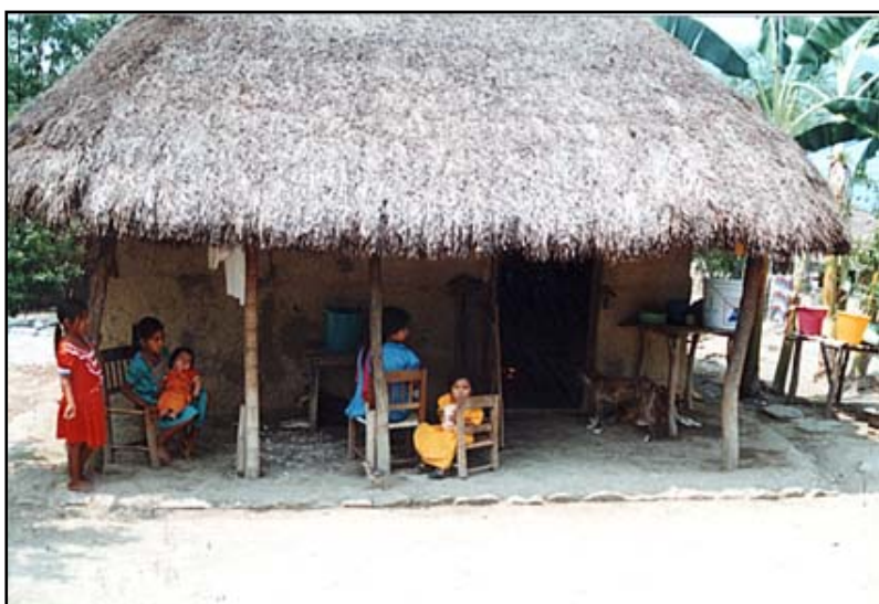
Chatrč – domácí církev

Nedávno přišla pro modlitbu jedna starší paní a za ní stál její syn. Myslel jsem si, že není