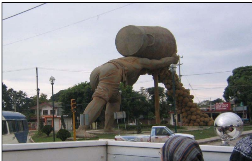
Socha muže, který vysypává sběr pomerančů z koše – Městečko někde v Mexiku

Jeden z našich pastorů, kterého jsem přivedl k Pánu, kázal evangelium v jedné vesnici, kde nikdy předtím neslyšeli jméno Ježíš. Je to můj dobrý přítel a strašně rád si jen tak sednu a poslouchám ho, jak káže evangelium. Opravdu velmi dobře káže, je o hodně starší než já. Nemají tam elektřinu, jen občas uvidíte, že ji někdo má. Nemají tam vodovod, žádné vymoženosti, které máte vy. Takže byli v této vesnici, měli s sebou nějaké traktáty a kázali o Ježíši. Když přišli k jednomu domu, tak vyšel muž a zeptal se jich, co chtějí. „Chceme vám jen říct o Ježíši.“ Ten muž neřekl ani slovo, ale vrátil se s dlouhou mačetou v ruce. „Už jsem na vás na všechny čekal.“ Snažil se je zabít, tak se všichni rozutekli. Tito kazatelé vědí jak utíkat – zvláště v pralese. Když už nějakou dobu honil tohoto pastora po lese, tak se k němu pastor otočil a řekl mu: „Co je s tebou?“ „Já tě zabiji!“ „Já jsem ti ale nic neudělal.“ „Ale ano, udělal!“ „A co jsem ti tedy udělal?“ „Tvá vina spočívá v tom, co jsi neudělal.“ Chápete to? Z toho, co neděláte, právě z toho budou křesťané souzeni. Můžeme citovat krásné verše a zpívat nádherné písně, ale když opustíte ty dveře církve... tak jen hrstka lidí je schopna konat Boží vůli. Něco není v pořádku. To je špatně připravená armáda. Takže on vzal tohoto pastora