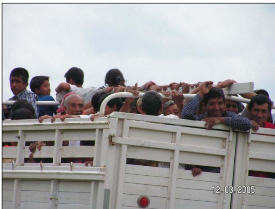
Šťastní Indiáni na korbě nákladáku

Když jsem sloužil v Austrálii, měli jsme dvanáct shromáždění a řeknu vám, že lidé byli spaseni na každém z nich a byli uzdravováni ze všech nemocí. Během deseti dnů bylo spaseno více jak 100 lidí. Jeden muž tam povstal z invalidního vozíku. Jedno dítě, které tam přinesli s nějakou nevyléčitelnou nemocí, bylo okamžitě uzdraveno. Ten chlapec byl ochrnutý a když jsme se za něj modlili, tak padl pod Boží mocí na zem a když vstal, tak byl uzdraven skrze jméno Ježíš.